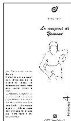
Le canzoni di Yassine